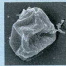
© ANDERSON I ET AL. (2011) STAND GENOMIC SCI 4, 3

Isolée d'un site hydrothermal de la dorsale médio atlantique, cette archée anaérobie stricte est capable de se diviser jusqu'à 113 °C.